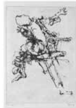
Yoke van der Flier